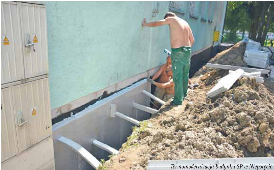
Termomodernizacja budynku SP w Nieporęcie