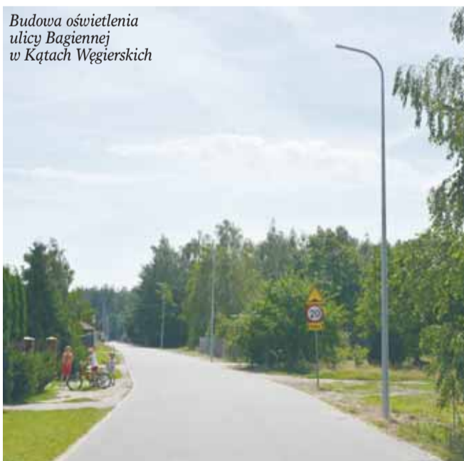
Budowa oświetlenia ulicy Bagiennej w Kątach Węgarskich