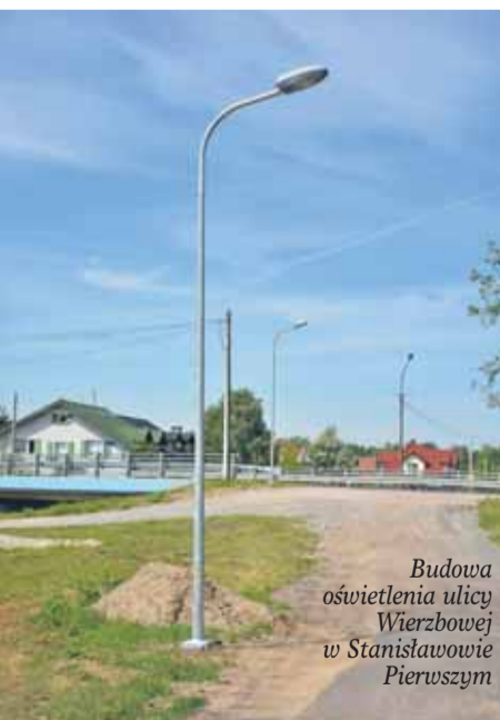
Budowa oświetlenia ulicy Wierzbowej w Stanisławowie Pierwszym